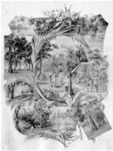
Le jardin de Richard Toll par Merwart en 1898.